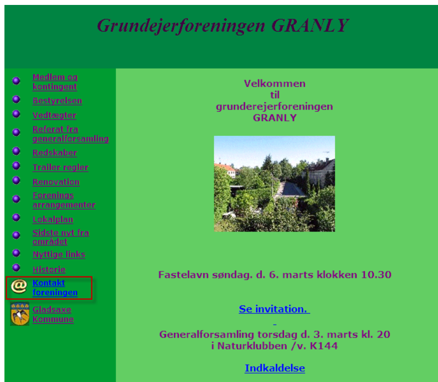
Figur 1 www.sandkrogen.dk med angivelse af hvor man kan kontakte foreningen

E-mail adresserne vil ikke blive lagt offentligt ud på hjemmesiden.